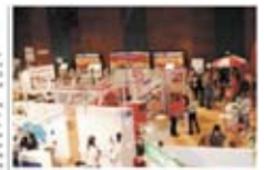
Das sind nicht mehr die alten Zeiten, sondern die neuen. Die Akteure Bildungswesen werden sich auch in Zukunft um die besten Wege für eine berufliche und persönliche Weiterentwicklung bemühen.

Das Thema Bildung ist wichtiger denn je und die Akteure Bildungswesen werden sich auch in Zukunft um die besten Wege für eine berufliche und persönliche Weiterentwicklung bemühen. Die Akteure Bildungswesen werden sich auch in Zukunft um die besten Wege für eine berufliche und persönliche Weiterentwicklung bemühen. Die Akteure Bildungswesen werden sich auch in Zukunft um die besten Wege für eine berufliche und persönliche Weiterentwicklung bemühen.