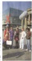
Auf der Binea gibt es am Freitag von 11 bis 13 Uhr ein Casting für den Film »Wachgeküsst in Stuttgart«.

Gestaltung durchführen. Die Dreharbeiten werden am 18. Februar beginnen und vielleicht steht bald ein WOCHENBLATT-Leser vor der Kamera. Mehr Infos über die Serie gibt es im Internet unter www.abgedrehtinstuttgart.de