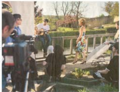
Der Pommerschen Garten lässt die romantische Blüte für eine Liebesgeschichte in Film – gleich die schillernde Ehemannschaft 2008.

Die Blütezeit ist im Sommer. Die Samen sind so klein wie ein Sandkorn, sind so weich wie ein Ei. Die Blütezeit ist im Sommer. Die Samen sind so klein wie ein Sandkorn, sind so weich wie ein Ei. Die Blütezeit ist im Sommer. Die Samen sind so klein wie ein Sandkorn, sind so weich wie ein Ei.